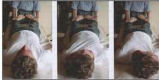
Figure 8. Examen de la convergence podale (QUERCIA, 2008).

Mercredi 3 février : Nous avons vu le Dr Quercia ce matin . La manœuvre de convergence podale n'était pas bonne comme cela avait été vu précédemment par le podologue.