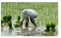
Culture du riz

Permet de nourrir une population nombreuse