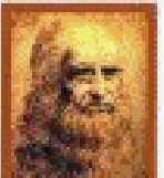
Léonard de Vinci peintre et savant