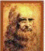
Léonard de Vinci peintre et savant