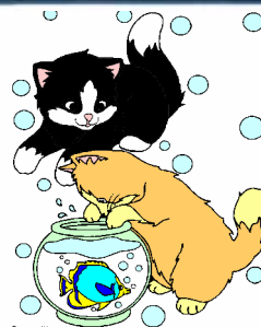
les petits chats