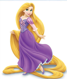
la jolie princesse