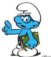
le schtroumpf à lunettes