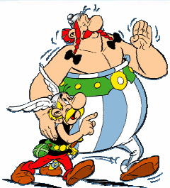
Astérix et Obélix